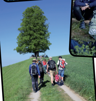
Gemeinsam auf dem Maibummel